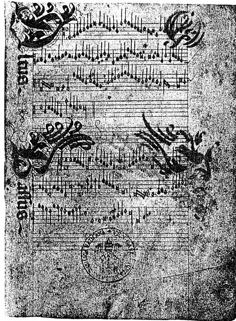
Rom, Archivio della Cappella Giulia, Cod. cart. sec. XVI fol. 1-2 »Palle, palle« ein Loblied auf die Medici.